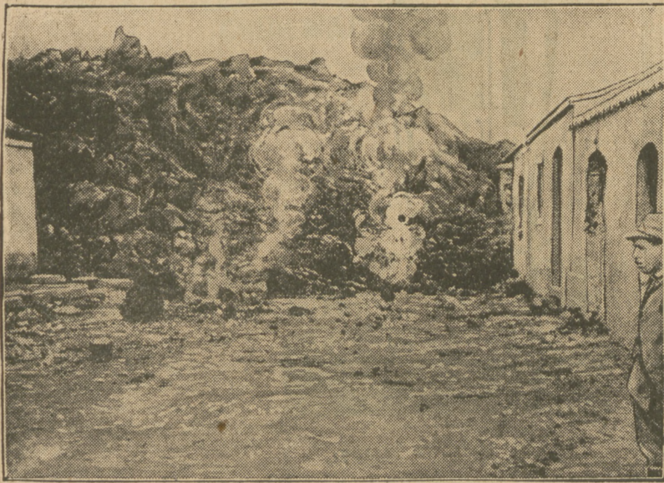
Lawa, płynąca z Etny, posuwa się bez przerwy: naprzód, szerząc śmierć i zniszczenie.