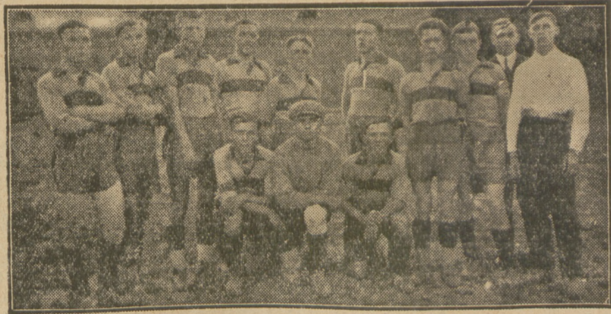
4.R.K.S. Świt mistrz kl. B W.R.S.K.O.