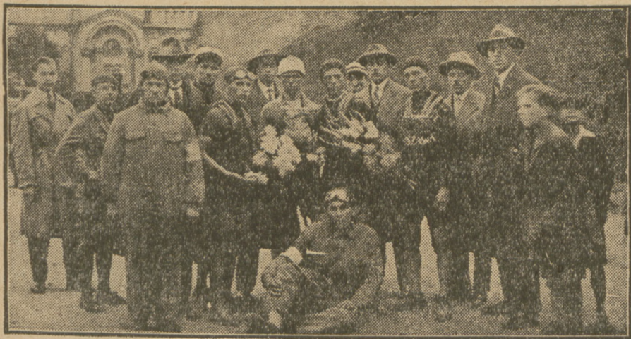
Kolarze z robotniczych klubów w „Tour de Pologne” w przejeździe przez Łódź.