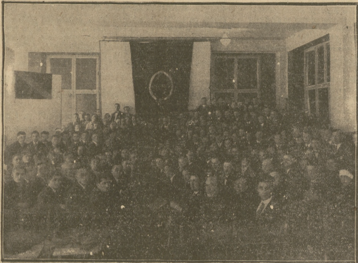
Delegaci oraz goście na III Kongresie Z. R. S. S. z Marszałkiem Sejmu, tow. Daszyńskim na czele.

Bez sprzeciwu wybrany został nowy Zarząd, którego skład podaliśmy w „Robotniku” z dnia 5 b. m.