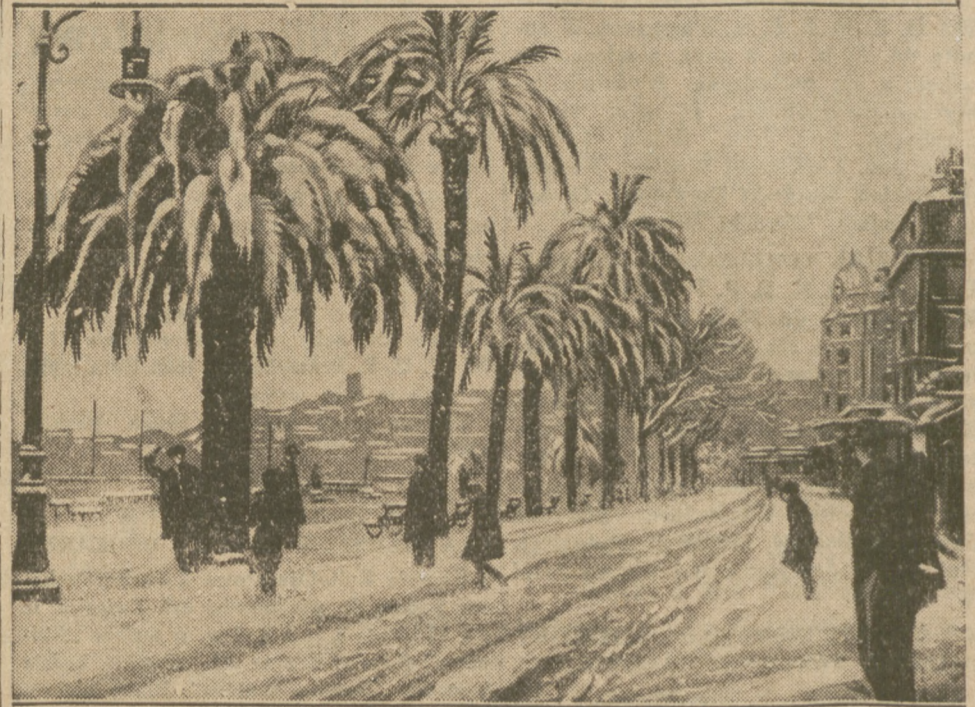
W Cannes (południowa Francja) wysokie palmy po raz pierwszy zostały pokryte śniegiem, a ludność „zapoznała się” z naszą zimą.