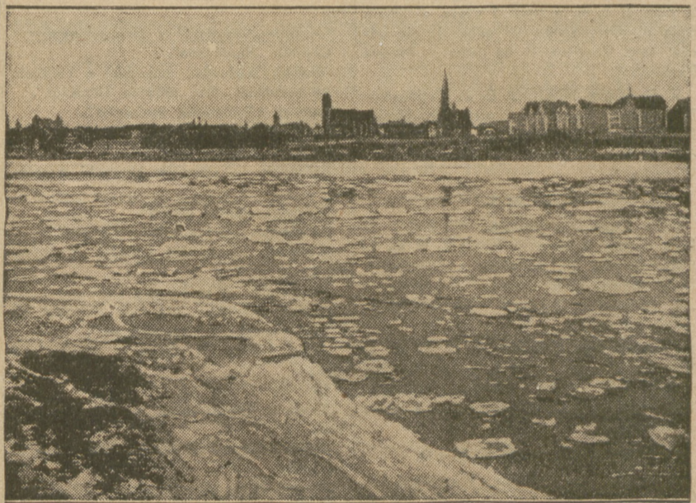
Pod Toruniem ruszyły lody na Wiśle, zagrażając całej okolicy powodzią.

WARUNKI PRENUMERATY: w Warszawie z odnośnieniem miesięcznie zł. 5.40, bez odnośnienia zł. 4.70, na prowincji miesięcznie zł. 5.40, zagranicą zł. 8.— Za zmianę adresu 50 gr. CENY OGŁOSZEŃ: Za wiersz wysokości 1 milimetra w tekście gr. 50, zwyczajnie gr. 20, komunikaty i nadesłane gr. 80, nekrologi do 60 mm gr. 20, powyżej 60 mm. gr. 30, drobne za wiersz gr. 20. Poszukiwanie i zaofiarowanie pracy o 50 proc. taniej. Ogłoszenia tabelaryczne i fantazyjne o 50 proc. drożej. Ogłoszenia zagraniczne o 50 proc. drożej. Układ ogłoszeń w tekście 5-szpaltowy, układ zwyczajnych — 10 szpaltowy. Za terminowy druk ogłoszeń Administracja nie odpowiada.