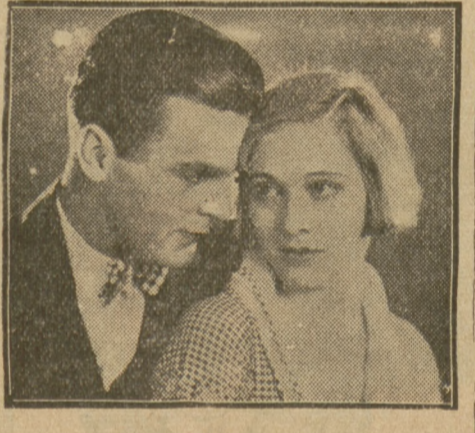
Najnowsza „gwiazda” wytwórni „Paramount”.

Prócz brzydkiej japonki, siostry znakomitego Haia Kawy nie widzimy dotąd mongolek. Na ekranie to też pojawienie się tej sličnej i niezwykle subtelnej chinki zostało powitane z prawdziwym entuzjazmem. Kto chce zapoznać się z jej przedziwnym czarem, niech idzie na „Picadilly”.