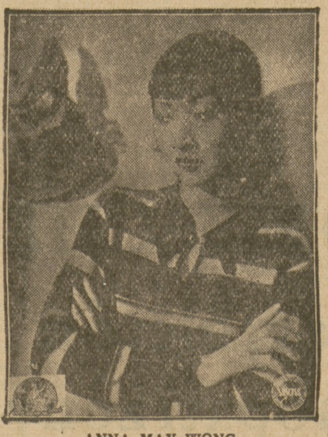
ANNA MAY WONG w filmie realizacji E. A. Duponta p. t. „Świat Nocy (Picadilly)” (wyświetlany obecnie w kinie „Casino”).

Anna May Wong ukazała się w rolach epizodycznych kilka razy i już wtedy odrzucała powściągnięta uwagę przedziwną zupełnie swoistą urodą.