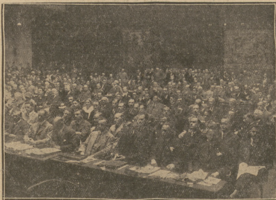
Otwarcie XII Międzynarodowej Konferencji Pracy w Genewie