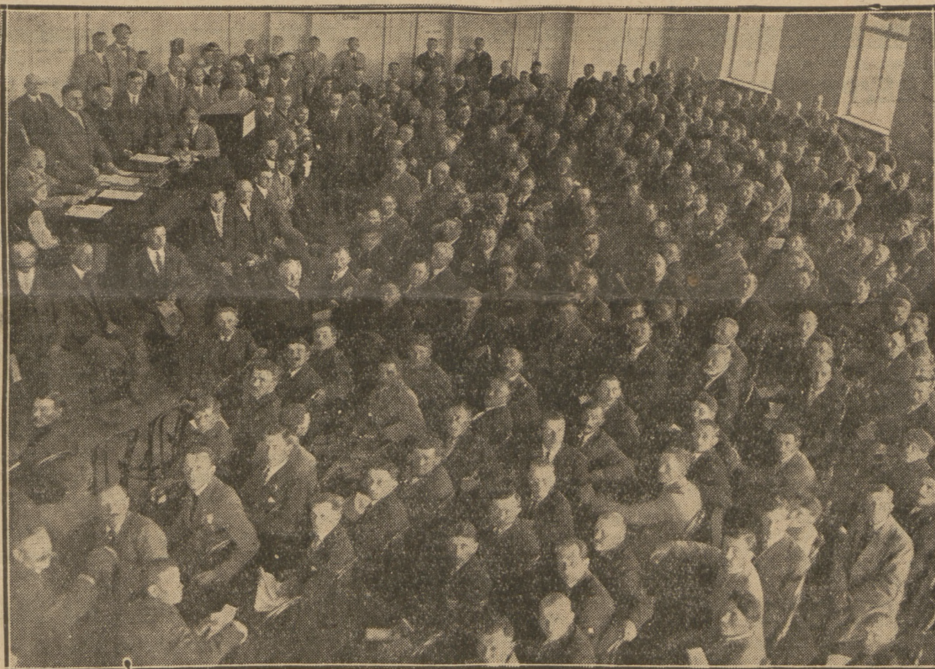
KONGRES P. S. L. „WYZWOLENIE“ zakończony wczoraj w Warszawie

Warszawski Okręgowy Komitet Robotniczy P. P. S.