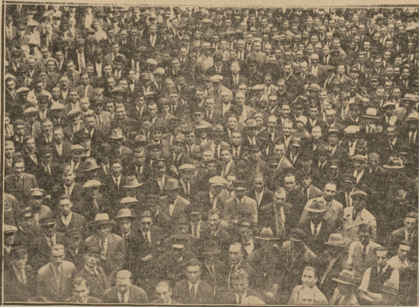
Tłumy strajkujących kierowców, zgromadzonych na podwórzu domu przy ul. Wareckiej 7 na wielkim wiecu w dniu 7 b. m., zwołanym przez Zw. Zaw. Automobilistów Rzplitej Polskiej.