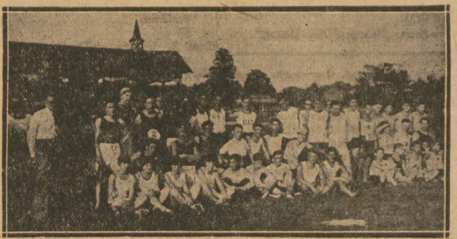
Zawody lekkoatletyczne o robotnicze mistrz. Polski w Krakowie. Reprezentacja Krakowskiego R. S. K. O.

Tabela ligowa przedstawia się obecnie jak następuje: 1) Wisła 25 pkt., 2) Warta 24 pkt., 3) ŁKS. 23 pkt., 4) Garbarnia 22 pkt., 5) Legja 21 pkt., 6) Cracovia 19 pkt., 7) Warszawianka 17 pkt., 8) Czarni 16 pkt., 9) Polonia 16 pkt., 10) I. F. Cł 15 pkt., 11) Ruch 14 pkt., 12) Pogoń 12 pkt., 13) Turyści 12 pkt.