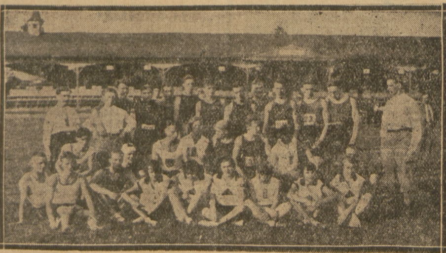
Zawody lekkoatletyczne o rob. mistrz. Polski w Krakowie. Reprezentacja Warszawskiego R.S.K.O.