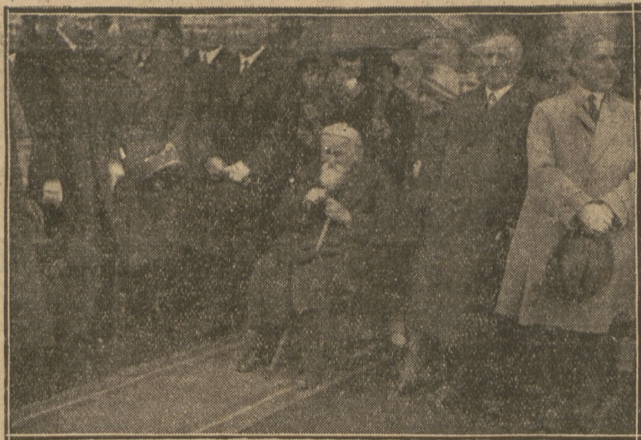
TOW. SEN. B. LIMANOWSKI

pasażerskiego w pobliżu Wiatki zabitych zostało 45 osób, a 36 odniosło rany.