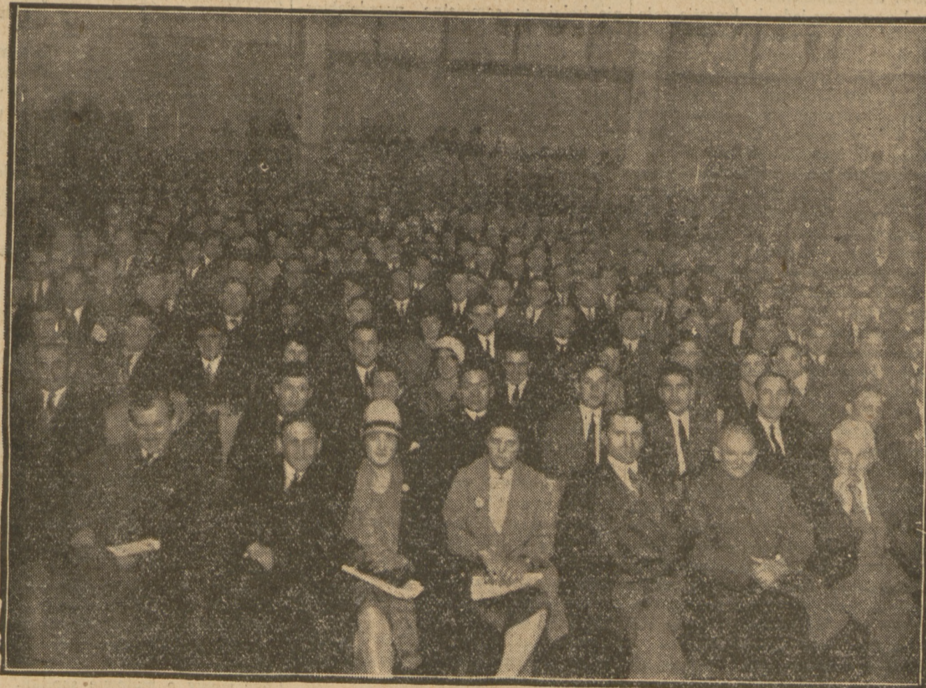
2500 robotników polskich i żydowskich wypełniło wielką salę teatru Kamińskiego po brzegi

Radykali zaś — o ile mamy szukać uzasadnienia ich taktyki — użyli wniosku świadomie w celach obalenia rządu. Od czasu ustąpienia z koalicji „narodowej” radykali systematycznie przygotowywali się do oczyszczenia drogi rządowi lewicy. Wśród radykałów góruje prąd ku porozumieniu z socjalistami i wyłonieniu większości centrolewej. Opozycja radykałów do rządu Brianda ma swe źródło nietylko w odmiennych poglądach na politykę zagraniczną, ile w sprzeciwie do jego polityki wewnętrznej, głównie w sprawach rozbrojenia, szkolnictwa, po-