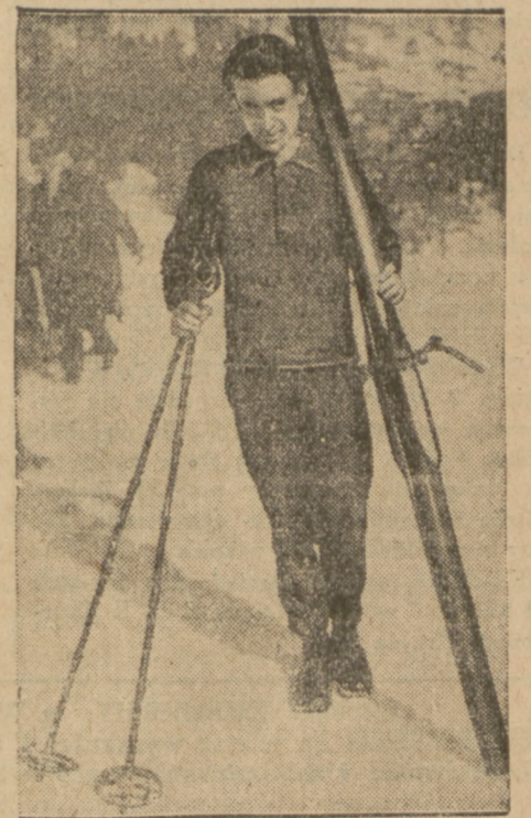
Świetny narciarz czeski zajął pierwsze miejsce w biegu na 18 km., wchodzącym w zakres programu akademickich mistrzostw świata w Davos.