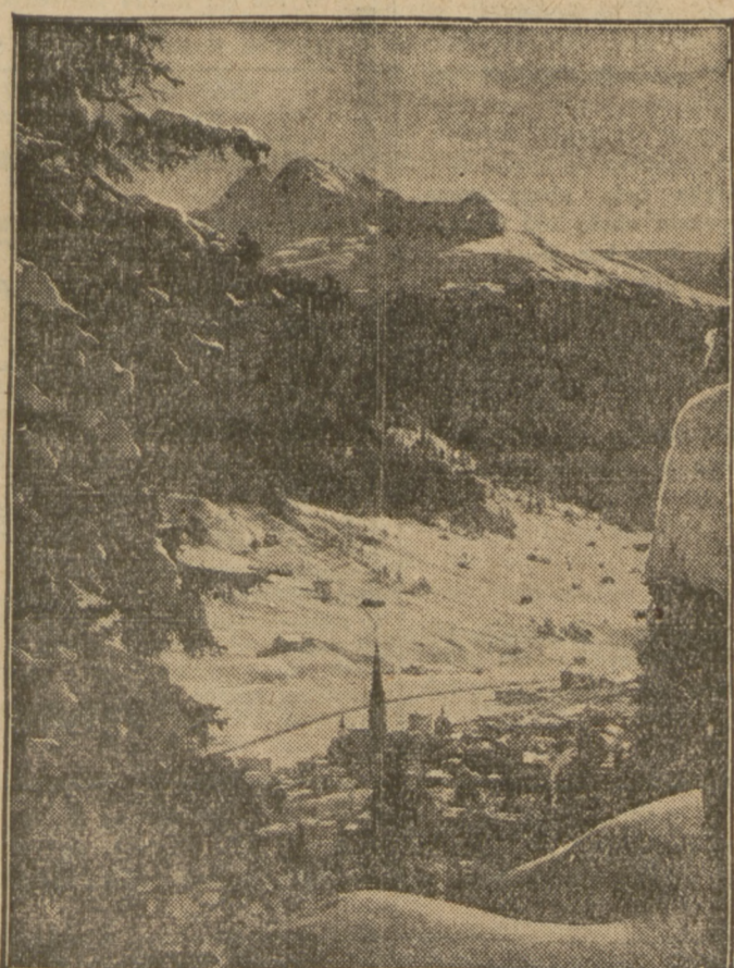
Stolica sportów zimowych Europy była ostatnio świadkiem akademickich mistrzostw świata w sportach zimowych.