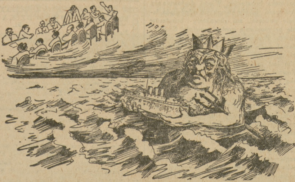
NEPTUN (bóg morza): nie zabiorą mi moich zabawek...

WARUNKI PRENUMERATY: w Warszawie z odnośnieniem miesięcznie zł. 5.40, bez odnośnienia zł. 4.70, na prowincji miesięcznie zł. 5.40, zagranicą zł. 8.—. Za zmianę adresu 50 gr. CENY OGŁOSZEŃ: Za wiersz wysokości 1 milimetra w tekście gr. 50, zwyczajne gr. 20, komunikaty i nadesłane gr. 80, nekrologi do 60 mm. gr. 20, powyżej 60 mm. gr. 30, drobne za wyraz gr. 20. Poszukiwanie i zaofiarowanie pracy bezpłatnie. Ogłoszenia tabelaryczne o 50 proc. drożej. Ogłoszenia zagraniczne o 50 proc. drożej. Układ ogłoszeń w tekście 5-szpaltowy, układ zwyczajnych — 10-szpaltowy. Za terminowy druk ogłoszeń Administracja nie odpowiada.