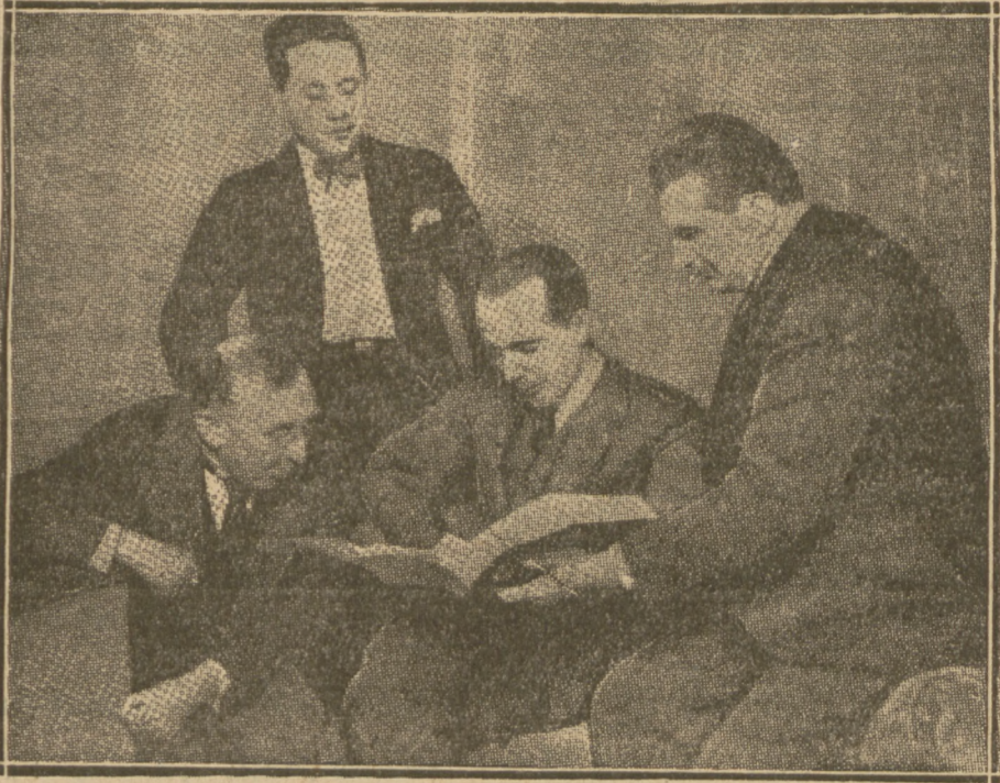
Nobile przegląda akta i sprawozdanie urzędowej Komisji.

Cały charakter Nobilego zaznaczył się już w czasie początkowych układów. Amundsen pisze dosłownie: — „Prawdą jest, że jeszcze przed odlotem „Norge” Nobile wziął Riisera-Larsena na stronę i zażądał od niego słowa honoru, że w razie przymusowego lądowania na lodzie, Norwegowie nie porzucą Włochów