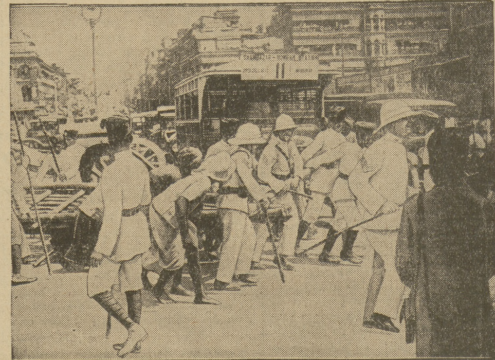
BARYKADY NA ULICACH KALKUTY

100. Na nasze ilustracji: z prawej strony Świątynia hinduska w Peszawarze, a z lewej główna ulica w mieście.