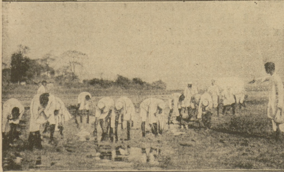
HINDUSI PRZY WYDOBY WANIU SOLI Z MORZA.

To są wszystkie na zewnątrz mało rewolucyjne środki i to przeciw takiej potędze, jak angielska. A jednak w Londynie zaczęto się denerwować. Wpłynęły na to dwie okoliczności: po pierw-