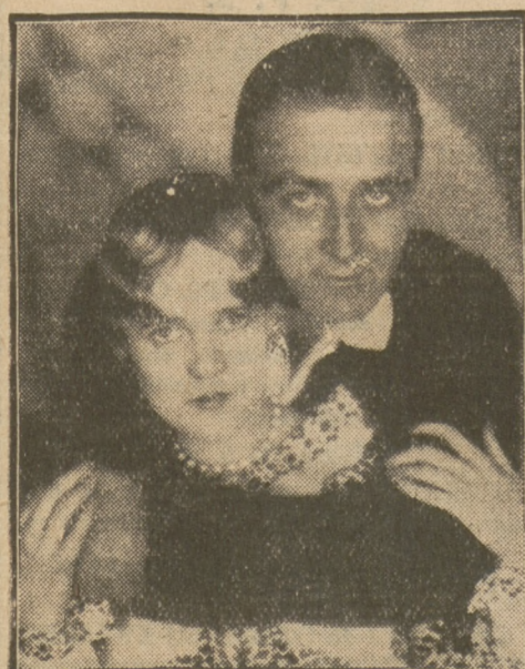
RUTH TAYLOR I JAMES HALL „gwiazdy” amerykańskich wytwórni „Paramount”. „Ostatni Walc”.