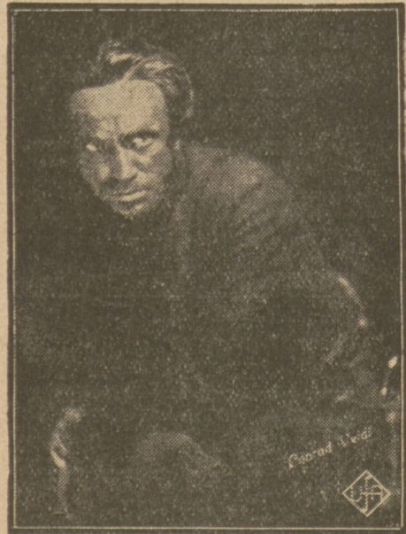
CONRAD VEIDT w swym pierwszym dźwiękowym filmie „Ostatni Walc”.