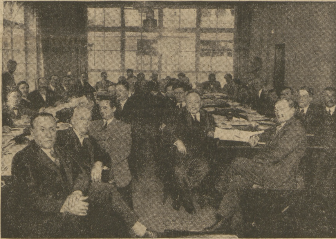
POSIEDZENIE EGZEKUTYWY MIĘDZYNARODÓWKI SOCJALISTYCZNEJ W BERLINIE

Inna uchwała stwierdza, iż górnictwo węglowe i rynki zbytu nadal pozostają w stanie chaotycznym, i że przeprowadzona obecnie racjonalizacja bez regulowania przemysłu w skali międzynarodowej i brania pod uwagę interesów i bezpieczeństwa robotników utrudnia problemat węglowy. Międzynarodówka Górnicza żałuje, że tak mało zrobiono postępu z uporządkowaniem produkcji węglowej, mimo, że górnictwo znowu stanęło wobec ciężkiego przesilenia. Uchwała zwraca się do Ligi Narodów o zajęcie się tą sprawą z lepszym, niż dotychczas, skutkiem.