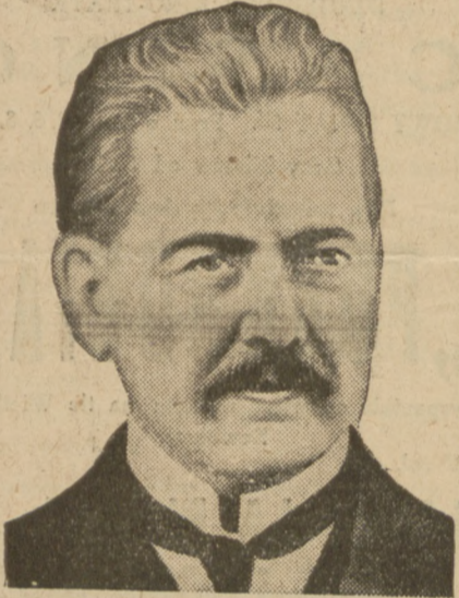
PREZYDENT ARGENTYNY IRYGOYEN.

W związku z tą naprężoną sytuacją w republikach południowo-amerykańskich spadły wszystkie obligacje tych państw na giełdzie nowojorskiej.