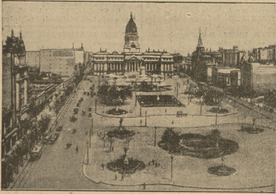
BUENOS AIRES STOLICA ARGENTYNY W PRZEDNIU WYBUCHU REWOLUCJI

WRZENIE REWOLUCYJNE W CAŁEJ AMERYCE POŁUDNIOWEJ