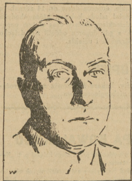
Dr. CURTIUS, Minister spraw zagranicznych Rzeszy, przywódca Partji Ludowej.