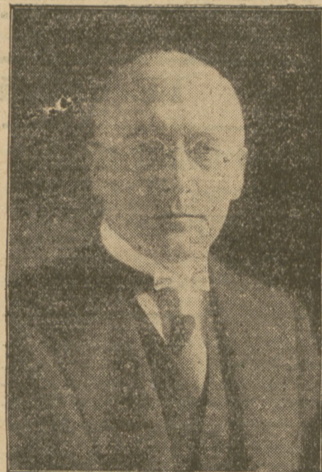
BRUNING, obecny reakcyjny kanclerz Rzeszy Niemieckiej, przywódca „Centrum“.