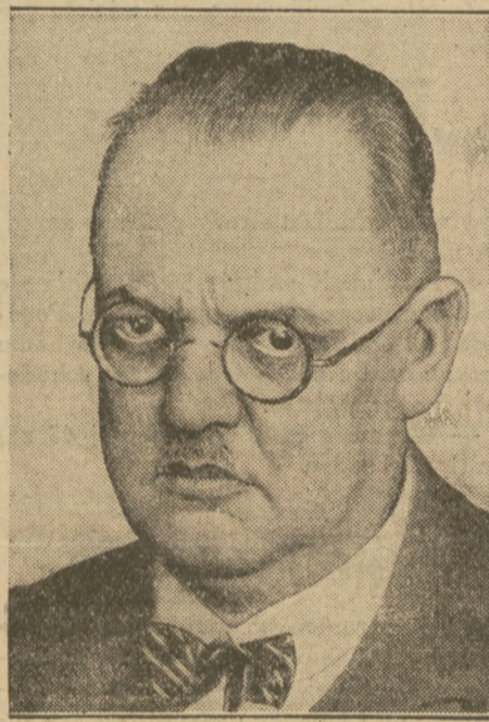
TOW. HERMAN MULLER, b. kanclerz Rzeszy Niemieckiej.