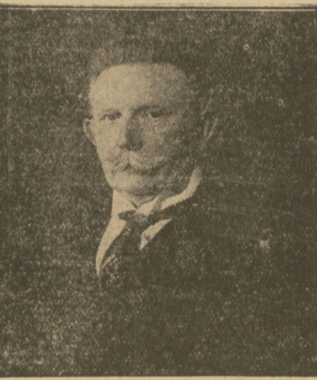
HUGENBERG, czołowy reprezentant nacjonalistów.