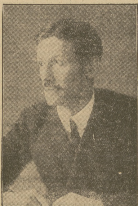
TOW. BREITSCHIED, przywódca socjalistów.