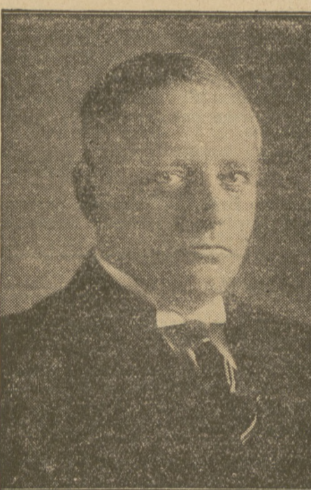
TREVIRANUS, leader konserwatystów.