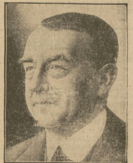
HENDERSON, Minister Spraw Zagranicznych w gabinecie Mac Donalda, jeden z najwybitniejszych uczestników Sesji Ligi.