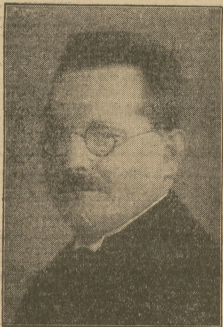
TOW. LOEBE, przewodniczący dotychczasowego Parlamentu.