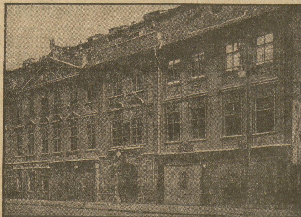
„DOM NIEMIECKI” W PRADZE.

W całym mieście krążą silne oddziały policji i żandarmerji.