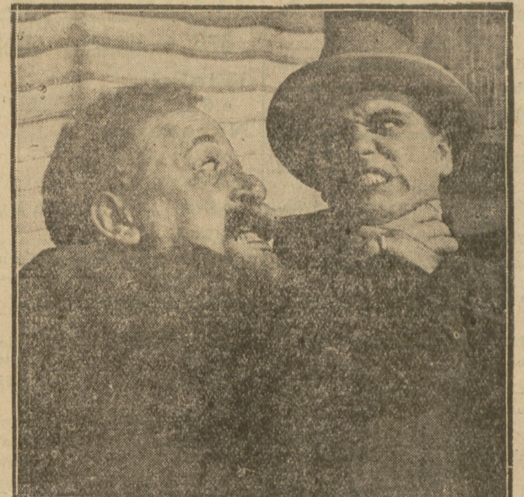
Realistyczna scena walki BOGUSŁAWA SAMBORSKIEGO z EUGENJUSZE BODO w 100% wym. dźwiękowcu polskim „Niebezpieczny Romans”, wyświetlanym w „Filharmonji” i „Pola Negri Palace”.

WARUNKI PRENUMERATY: w Warszawie z odnośnieniem miesięcznie zł. 5.40, bez odnośnienia zł. 4.70, na prowincji miesięcznie zł. 5.40, zagranicą zł. 8.—. Za zmianę adresu 50 gr. CENY OGŁOSZEŃ: Za wiersz wysokości 1 milimetra w tekście gr. 50, zwykajnie gr. 20, komunikaty i nadesłane gr. 80, nekrologi do 60 mm. gr. 20, powyżej 60 mm. gr. 30, drobne za wyraz gr. 20. Poszukiwanie i zaofiarowanie pracy bezpłatnie. Ogłoszenia tabelaryczne o 50 proc. drożej. Ogłoszenia zagraniczne o 50 proc. drożej. Układ ogłoszeń w tekście 5-szpaltowy, układ zwykajnych — 10-szpaltowy. Za terminowy druk ogłoszeń Administracja nie odpowiada.