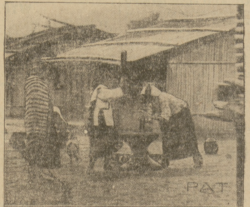
Wieśniacy chińscy starym prymitywnym sposobem obłuskują ryż.