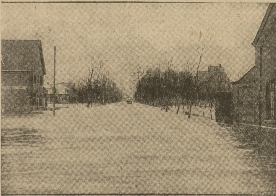
ZALANE PRZEDMIEŚCIA POD BRUK SELLA.

na. W niektórych miejscach ludność jeździ na łódkach.