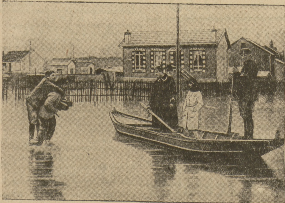
Z KATASTROFY POWODZI WE FRANCJI

później, wodospad „przespacerował się” o pięć kilometrów dalej i ukazał się w innej okolicy, bliżej Spezzi. Nie pozostało zatem nic innego, jak przenieść... elektrownię na nowe miejsce, gdyż cała okolica Rosaro jest narazie pozbawiona światła i prądu elektrycznego.