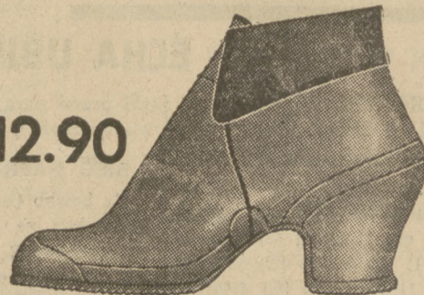
Fason 1865-01 Całogumowe śniegowce z ciepłą podszewką. Praktyczne i wygodne.