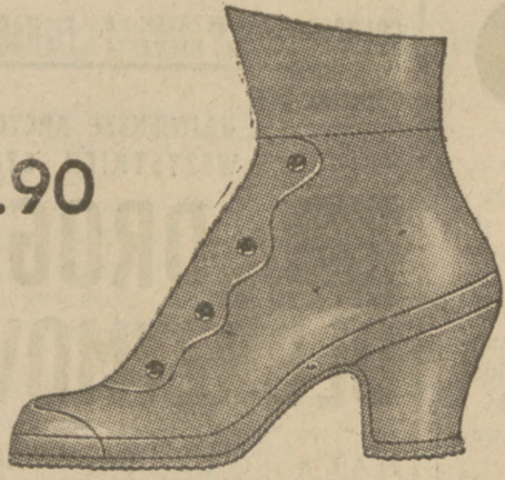
Fason 1085-25 Eleganckie obuwie deszczowe, całogumowe z zamknięciem zatraskowym.