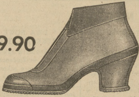
Fason 1885-05 W tych eleganckich, ciepłych śniegowcach, Wasze nóżki będą małe.