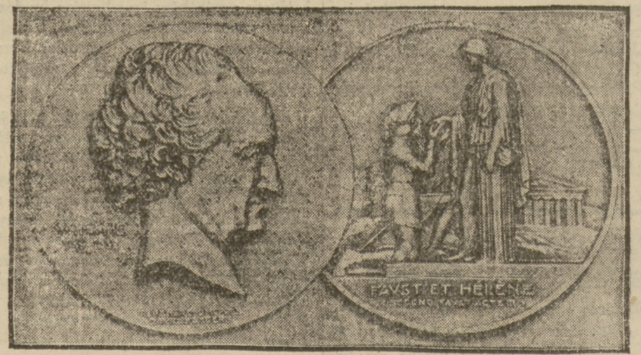
We Francji ukazały się ostatnio specjalne medale poświęcone pamięci Goethego.