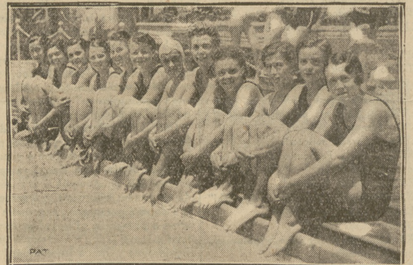
Oto dorodna grupa pływaczek amerykańskich, które skutecznie od swych męskich kolegów dały sobie radę z kolicją całego świata.