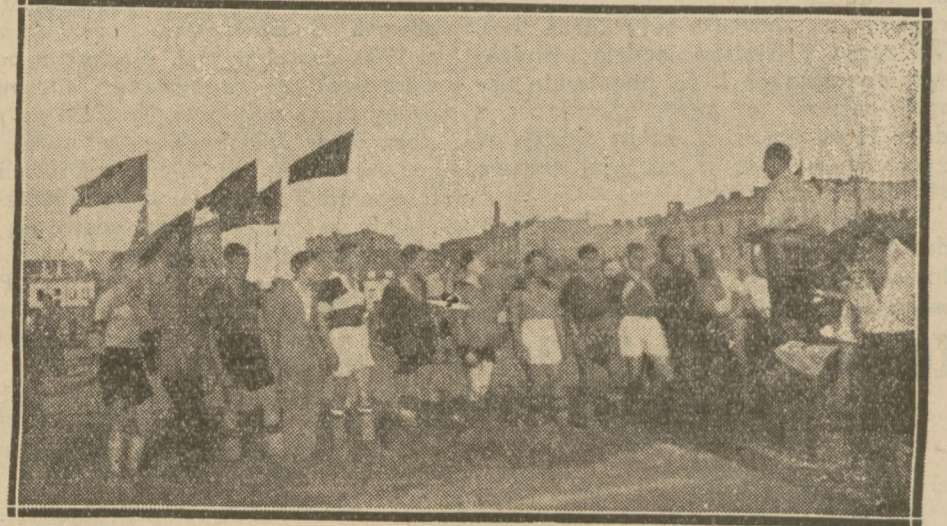
UROCZYŚCISCI ROZDANIA NAGRÓD.