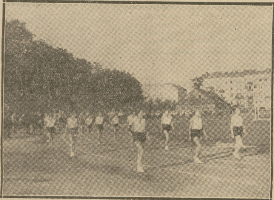
ZAWODNICZKI SKRY NA ZAWODACH LEKKOATLETYCZNYCH Z OKAZJI „TYGODNIA SPORTU ROBOTNICZEGO”.

Ze swej strony życzymy Rob. Klub. Sport. „Skra”, tak zasłużonemu dla sportu robotniczego, dalszych sukcesów i dalszego rozwoju. Przykład Skry dowodzi, ile można zrobić, gdy się ma silną wolę pokonywania trudności piętrzących się na drodze.