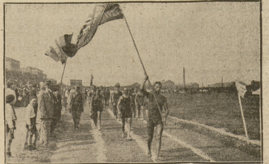
FRAGMENT Z DEFILADY ZAWODNIKÓW.

WARUNKI PRENUMERATY: w Warszawie z odnośnieniem miesięcznie zł. 5,40, bez odnośnienia zł. 4,70, na prowincji miesięcznie zł. 5,40, zagranicą zł. 8.—. Za zmianę adresu 50 gr. CENY OGŁOSZEŃ: Za wiersz wysokości 1 milimetra w tekście gr. 50, zwyczajne gr. 20, komunikaty i nadesłane gr. 80, nekrologi do 60 mm. gr. 20, powyżej 60 mm. gr. 30, drobne za wyraz 20gr. Poszukiwanie i zaofiarowanie pracy bezpłatnie. Ogłoszenia tabelaryczne o 50 proc. drożej. Ogłoszenia zagraniczne o 50 proc. drożej. Układ ogłoszeń w tekście 5-szpaltowy, układ zwyczajnych 10-szpaltowy. Za treść ogłoszeń Redakcja nie odpowiada.