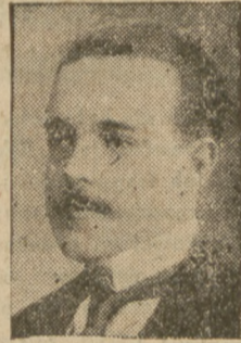
Manuel, b. król Portugalji.