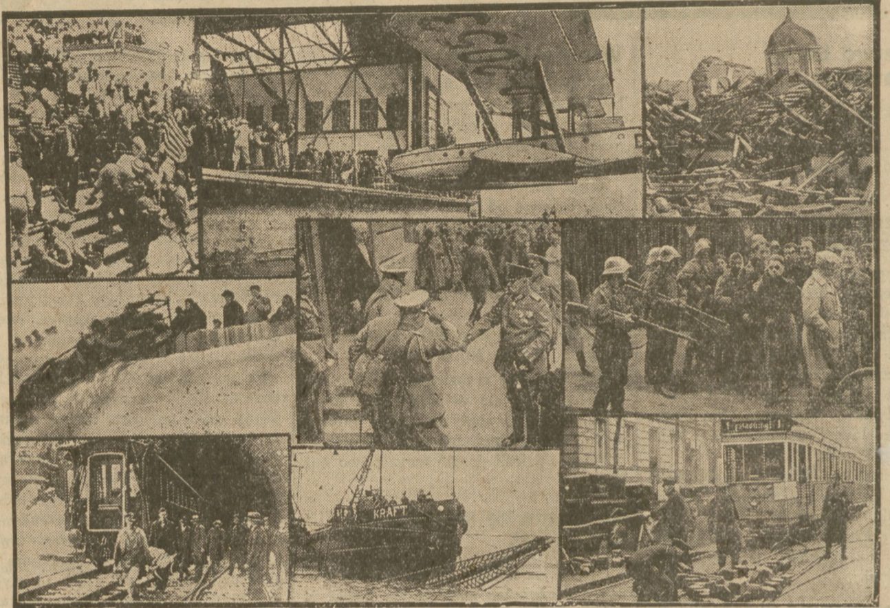
Na zdjęciach widzimy u góry od lewej strony: szturm weteranów na Kapitol, powrót Gronau z lotu dookoła świata, obrazek z trzęsienia ziemi w Grecji; w środku od prawej — krwawe rozruchy w Genewie, 85-lecie Hindenburga i straszną katastrofę na mistrzostwach bobslejowych w Berlinie; u dołu od lewej — katastrofa kolejowa w tunelu pod Lucerną, zatonięcie „Niobe” i strajk komunikacyjny w Berlinie