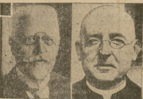
Schober, b. kanclerze Austrii. Seipel,