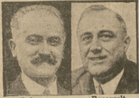
Lebrun wybrany Prezyd. Francji Roosevelt wybrany Prezyd. Stan. Zjedn.