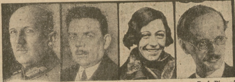
Gen. Schleicher Herriot. Amy Johnson, pobiła szereg rekordów lotniczych. Prof. Piccard wzniósł się po raz 2-gi do stratosfery.