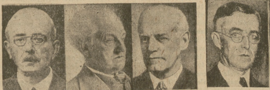
Scherington, zdobył nagrodę Nobla w dziedzinie medycyny. Hauptmann ukończył 70 lat. Galsworthy zdobył nagrodę Nobla w dziedzinie literatury. Langmuir uzyskał nagrodę Nobla w dziedzinie chemii.