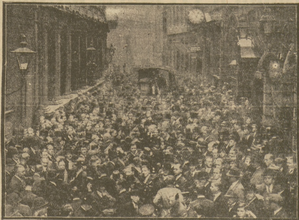
W związku ze zwykłą akcją pań niowo-afrykańskich kopalń złota zaplanowała na giełdzie londyńskiej panikę.