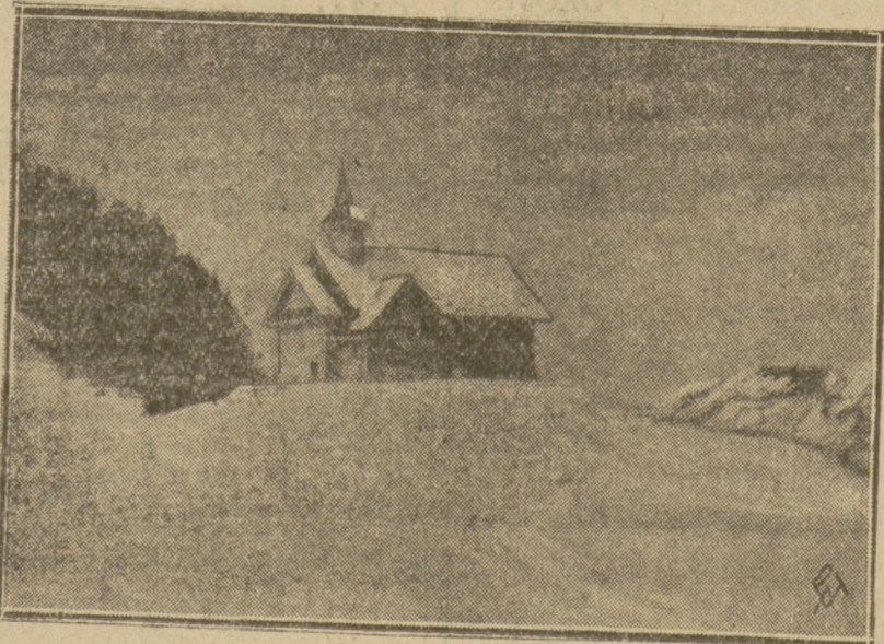
Na zdjęciu naszym widzimy typowy kościółek szwajcarski na szczycie zasypanej śniegiem góry koło Brunnen.