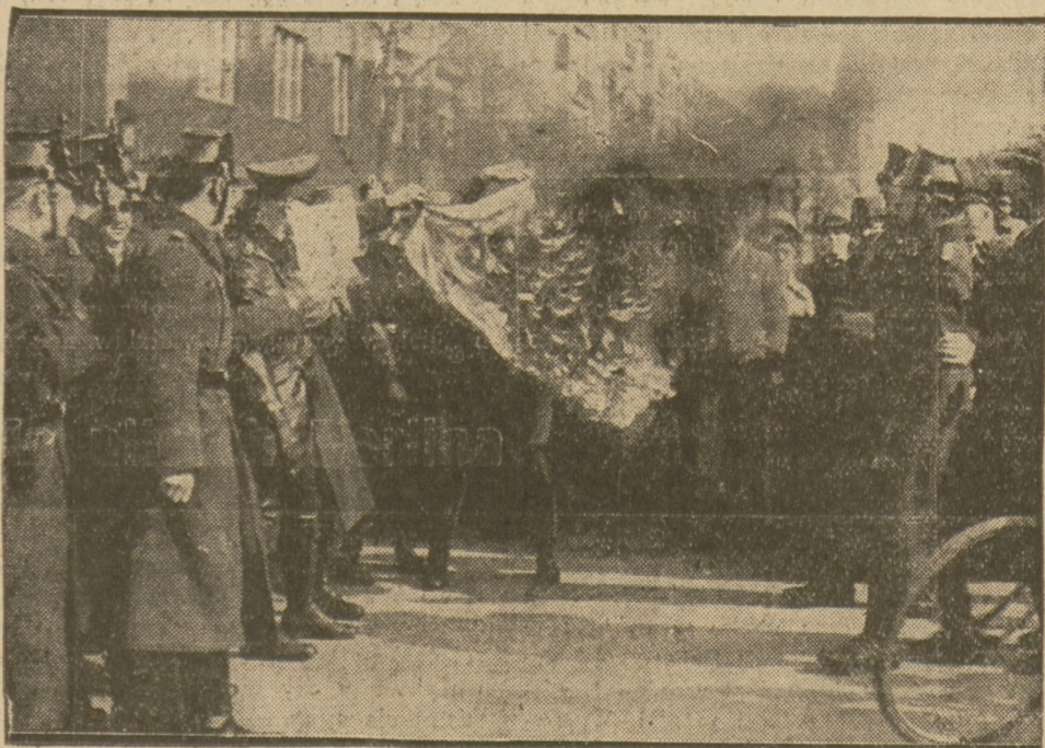
Bandy hitlerowskie do spółki z policją palą sztandary komunistyczne.