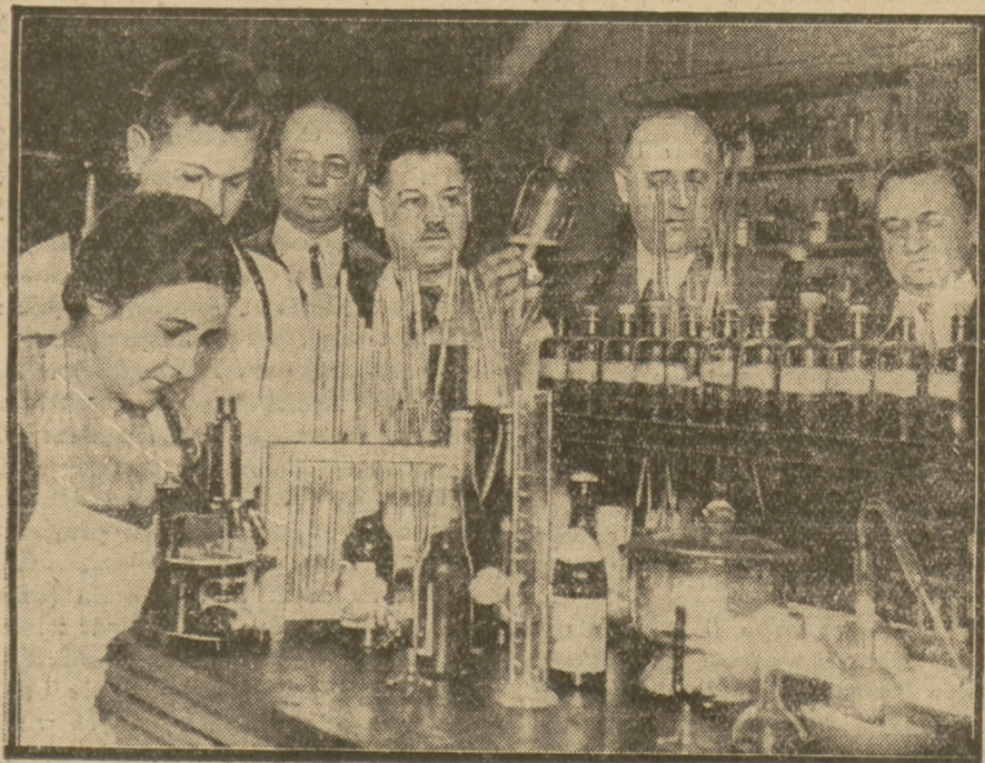
praktyczni Amerykanie uczą się robić piwo.