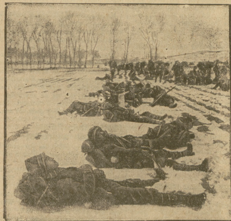
Wojska japońskie znajdują się już pod śpiących żołnierzy japońskich niedaleko Pekinem. Na zdjęciu widzimy oddział