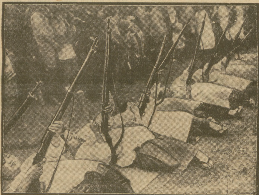
Kobiety w Japonii zostały również są ćwiczenia w ostrzeliwaniu samolotów. Na zdjęciu widoczne