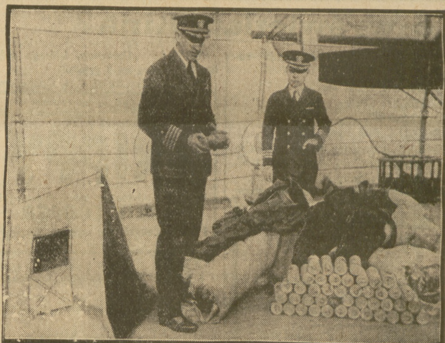
Zdjęcie nasze przedstawia przedmioty, jak'e znaleziono obok wydobytych z oceanu szczątków amerykańskiego sterowca: szczątki składu map, rakiety świetlne i części kostiumów ratunkowych.