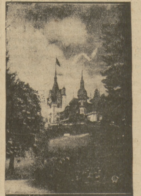
Zamek Pelesz w Sibiu w Rumunii.