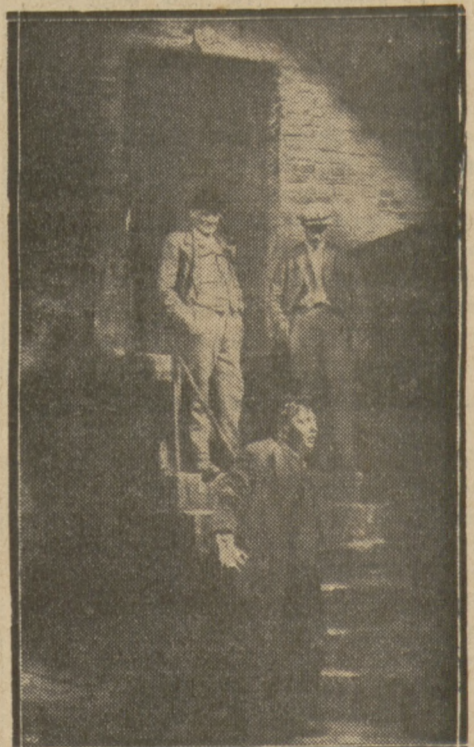
Emocjonująca scena z filmu reżysera Frydryka Lang'a p. t. „Morderca”, który się ukaże dziś w kinie „Majestic”.