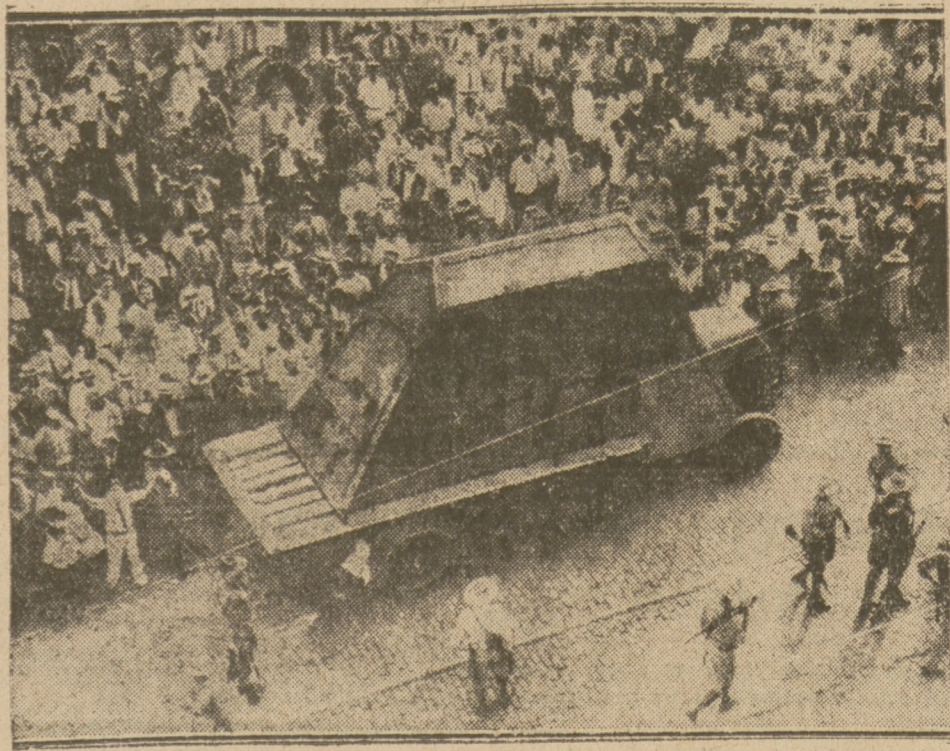
W Hawanie wybuchły nowe rozruchy. Na naszym zdjęciu tłum demonstruje przed pałacem Prezydenta.