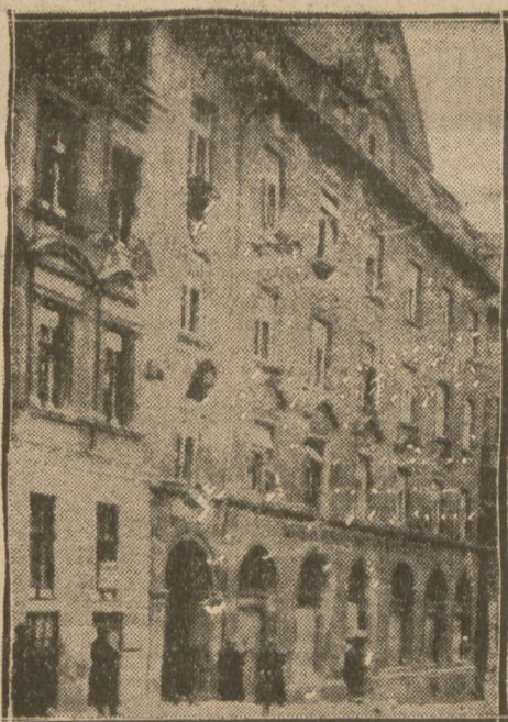
po zbombardowaniu przez artylerię band Heimwehry w Wiedniu.