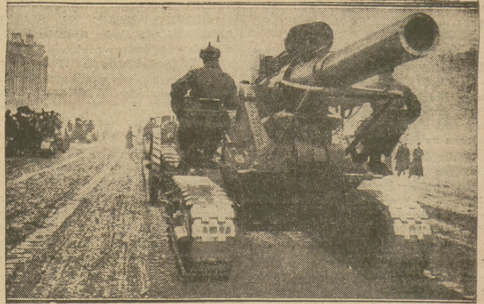
Parada artyleryjskich traktorów na Czerwonym Placu w Moskwie.