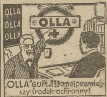
„OLLA GUM” — Najpewniejszy środek ochronny!

A.A.A.A.A.) TAPCZANY higieniczne, automatyczne patentowane 3722, złotych 50, oraz nowoczesne koczki, otomany. Warunki dogodny. Wytwórnia: Twarda 5 Tel. 247-67. BIŻUTERJE, brylanty, KWITY lombardowe kupuje, p'aci wysokie ceny. Hefen, Miodowa 2. Potrzebne kucharki, pokojówki, służące z dobrimi świadectwami. Pośrednictwo bezpłatne. Biuro Funduszu Pracy, Oddział Służby Domowej, Ciempla 21, tel. 2-53-27 i Mokotowska 50, tel. 9-61-44. 1 zł. tygodniowo aparaty fotograficzne Bielańska 21, podwórce.