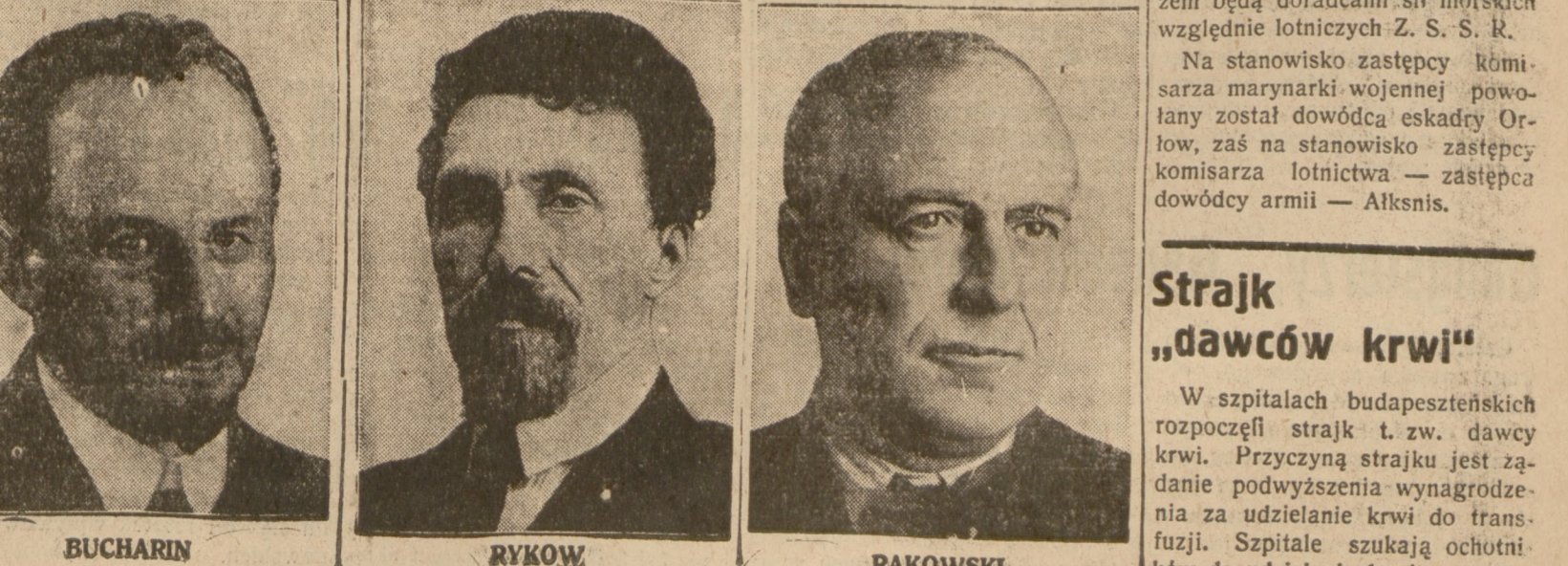
BUCHARIN RYKOW RAKOWSKI