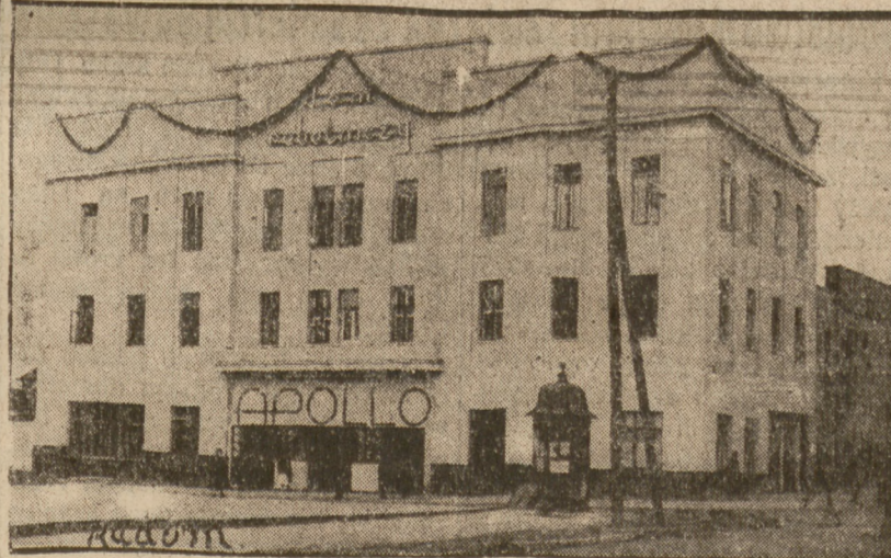
Miejsce obrad XXIV Kongresu P.P.S.