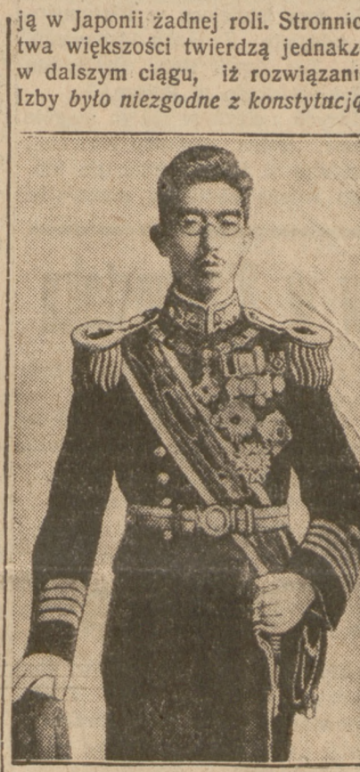
CESARZ JAPONII HIROHITO.

Agencja Domei donosi: Naprężenie pomiędzy Rządem japońskim a stronnictwami Minseito i Seyukai wzrasta w miarę zbliżania się dnia wyborów. Decyzja Rządu rozwiązania Izby reprezentantów, będąca zarządzeniem skierowanym przeciwko opozycji, spotkała się z poparciem stronnictwa „Showakai” i t. zw. Ligi Narodowej. Ale te partyjki nie odgrywa-