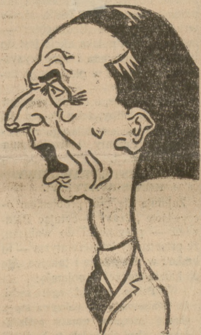
MIN. PROPAGANDY GOEBBELS

nie wspomina również o rozniowach sztabowych i formalnie uważane one będą za nieistniejące, ale w istocie rzeczy mocarstwowy plan obrony został w roku zeszłym wypracowany i dla utrzymania go w mocy wystarczy współdziałanie odnośnych attachés wojskowych, reprezentujących wszystkie zainteresowane rodzaje broni, których W. Brytania, Francja i Belgia wzajemnie posiadają w Londynie, Paryżu i Brukseli. Deklaracja kończy stwierdzeniem, że uzgodnione pomiędzy W. Brytanią a Francją istniejące gwarancje przeciwko niesprokowanej napaści pozostają w mocy bez zmian.