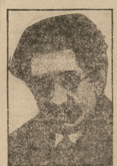
FRYDERYK ADLER Sekretarz generalny Międzynarodówki Socjalistycznej