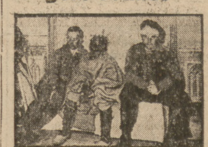
NIEMCY I MAROKANCYCZY WZIĘCI DO NIEWOLI.