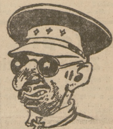
Gen. Molo Ten, który zapowiadał, że „zniesie Bilbao z powierzchni ziemi”.

WYMIANA JENCÓW. Z San Sebastian donoszą, że nastąpić ma nowa wymiana jeńców cywilnych. Wojska rządowe mają wydać 21 harcerzy, wziętych do niewoli w roku ub. w Saragossie, wzamian za trupę aktorów. Wymiana odbędzie się na moście międzynarodowym w Irun. (PAT).