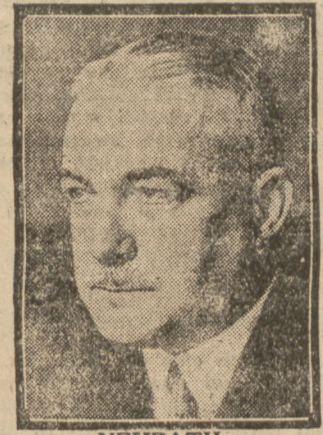
NEURATH. przez Rząd brytyjski ministra spraw zagranicznych Rzeszy barona Neu-

Nagła decyzja Rządu niemieckiego odkładająca przyjazd zaproszonego