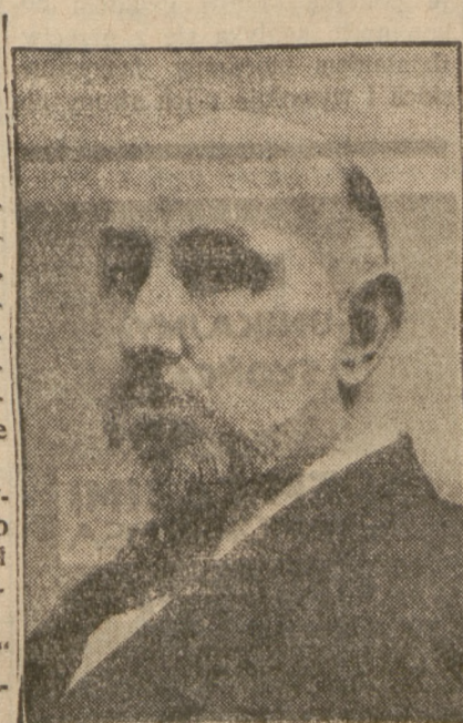
ANGEL OSSORIO Y GOLLORDO. Ambasador Republiki hiszpańskiej w Paryżu, którego artykuł o przyszłości Hiszpanii zamieszcza my na str. 2-giej.

W niedzielę odbyło się w Warszawie Spotkanie Młodzieży PPS. Okręgu warszawskiego i podwarszawskiego. Już wczesnym rankiem na boisku „Szkłanych domów” w osiedlu Warsz. Spółdz. Mieszcz. na Żolib. borzu poczęły się zbierać grupki młodzieży robotniczej ze sztandarami i flagami szturmowymi.