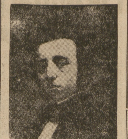
Nieznanym portret Fryderyka Szopena, umieszczony na wystawie.

Na zdobycie północnego szczytu góry Eiger w Szwajcarii, która pochłonęła ostatnio wiele ofiar, wybrało się dwóch młodych wprawnych alpinistów z Salzburga, po których zaginął wszelki ślad. Liczne ekspedycje austriackie, oraz niemieckie wyruszyły na poszukiwanie zaginionych.