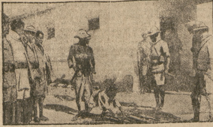
Przez granicę brytyjskiego Somali przechodzi tysiące Abisyńczyków, którzy uciekają ze zrabowanej przez faszystów Abisynii.

Ambasador ZSRR w Waszyngtonie otrzymał z Moskwy wiadomość, iż radiostacje w Moskwie i w Irkucku przejęły słabe sygnały, pochodzące, jak przypuszczają, od zagnionego lotnika Lewoniewskiego. Obecnie czynione są starania, celem ustalenia czy radiostacje wojskowe na Alasce i radiostacje kanadyjskie słyszały te same sygnały.