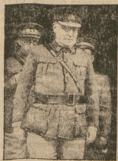
GEN. MIAJA, OBRONCA MADRYTU.

Agencja Stefani donosi, że w okolicach Borgo i Igea Marine w prowincji Rimini przeszła gwałtowna trąba powietrzna. Sześć domów zostało całkowicie zniszczonych, cztery osoby zostały zabite. 60 osób jest rannych, w tym 8 ciężko.