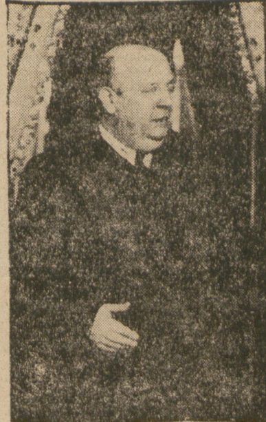
TOW. PRIETO, minister Obrony Narodowej Hiszpanii.

działów rządowych. Komunikat rządowy donosi o