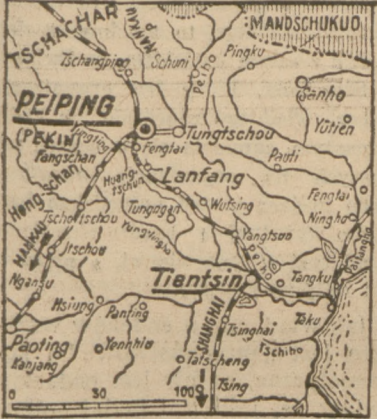
MAPA POŁNOCNYCH CHIN.

Okropne spustoszenie w milionowym mieście