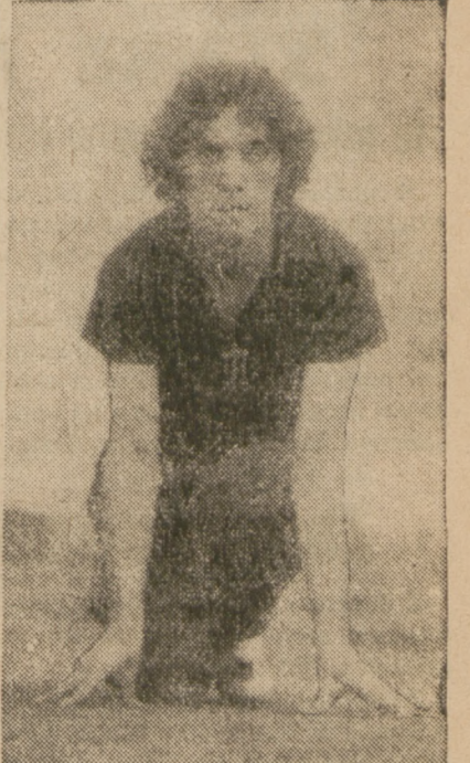
Najlepsza polska lekkoatletka Stanisława Walasiewiczówna pobiła rekord światowy na 50 mtr. osiągając czas 6,3 sek.