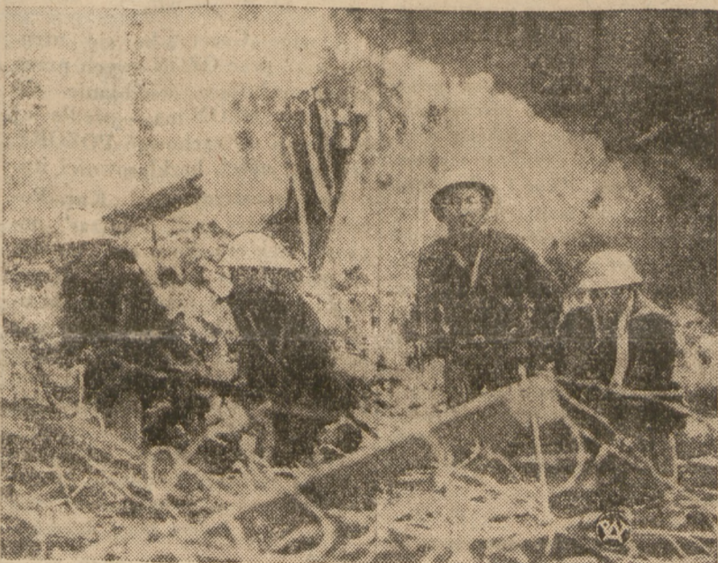
ODDZIAŁ ŻOŁNIERZY JAPONSKICH NA POSTERUNKU POD SZANGHAJEM.

W pobliżu Nan-Kiu Japończycy zgromadzili oddziały, liczące 10 tys. żołnierzy i przygotowują się do nowego ataku. W ciągu ostatnich dni posiłki japońskie, przybyłe z północnych Chin, wynoszą 30 tys. żołnierzy, a zatem armia japońska, operująca w obecnej chwili w Chinach, liczy około 80.000 ludzi.