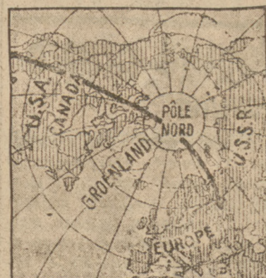
MAPA OKOLIC PODBIEGUNOWYCH Z TRASĄ LOTU.

Na pierwszym etapie do Damaszku załoga włoska Fiori i Lucchini wysunęła się na czoło, osiągając przeciętną szybkość 424 km na godz. Drogę do Damaszku lotnicy przebyli w 6 godz. 52 min. 2) załoga włoska Cupini — Barrawisi 6 godz. 53 m., 3) exequo zajmują załogi włoskie Tondi — Moscatelli i Biseo — Mussolini. Piąte miejsce zajmuje załoga Rovis — Trinebilo, szóste również załoga włoska Rolandi — Bonini, 7) załoga włoska Gaeta — Puesta, 8) załoga włoska Lupicastelani, dziewiąte i dziesiąte miejsce exequo zjeli Anglik Clouston i Codos, którzy przebyli trasę w 8 godz. 30 min. Na jedenastym miejscu znajduje się samolot francuski, pilotowany przez plk. Francois, który osiągnął czas 8 godz. 57 m. Dwunaste miejsce zajął Guillaumet, mający czas 10 godz. 25 m. Samolot Rossiego uległ w drodze wypadkowi i musiał się wycofać.