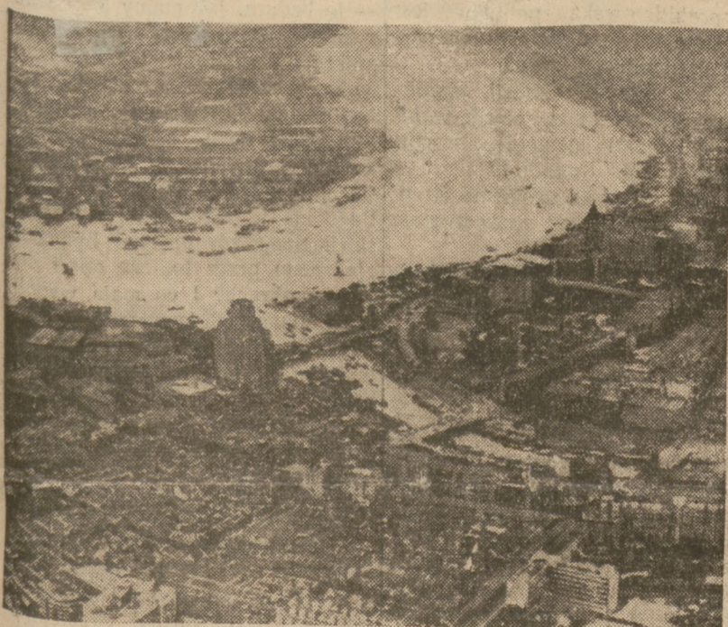
Szanghaj z lotu ptaka

Ambasada chińska w Londynie otrzymała z Nankinu depeszę, donoszącą o nowych sukcesach wojsk chińskich, które odparły oddziały japońskie w koncesji międzynarodowej na południe od rzeki Su-Czeu. Japończycy usiłowali ponownie wylądować w okolicy Pu-Tung, zamiar ten został jednak udaremniony przez oddziały chińskie.