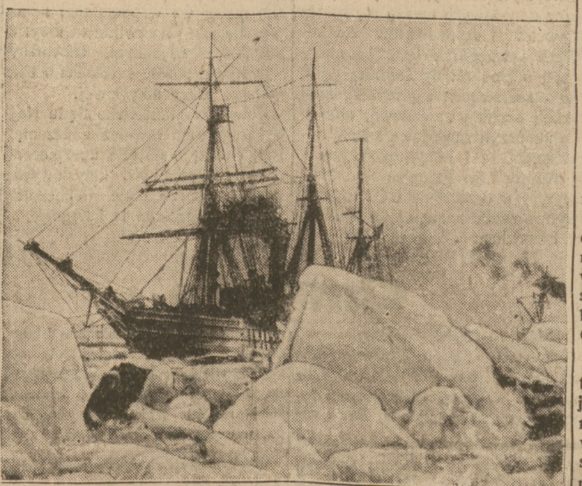
OKRĘT UWIĘZIONY W LODACH PODBIEGUNOWYCH.

Prezydent Turcji Kemal Ataturk wraz z członkami gabinetu i szefem sztabu generalnego powrócił wczoraj z manewrów do Stambułu. Wczorajem odbyło się posiedzenie gabinetu, na którym omawiana była sprawa działalności tajemniczych łodzi podwodnych, atakujących statki po przejeździe przez cieśninę Dardanele.