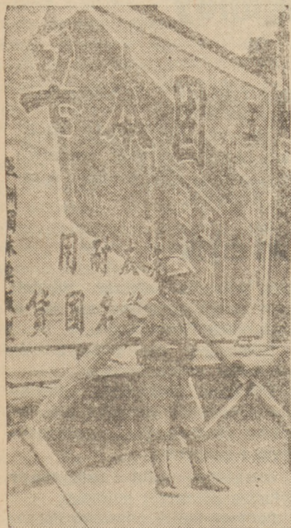
POSTERUNEK JAPONSKI W SZANGHAJU

Za pośrednictwem mikrofonu radiowego prezydent centralnej rady politycznej w Nankinie (premier) Wang-Czin-Uey przemówił do obywateli, oświadczając m. in., że obecne wypadki nie przyniosą porażki Chinom, lecz pociągną za sobą katastrofę gospodarczą Japonii.