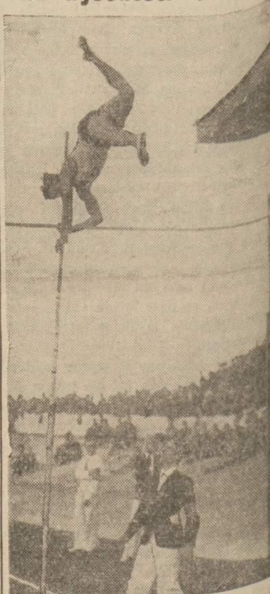
PIĘKNY SKOK SZLĄZAKA SZNAJDRA O TYCZCE