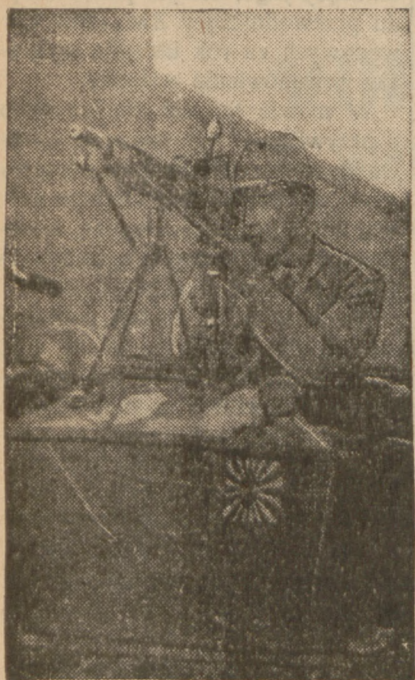
Żołnierz japoński przy celowniku karabinu maszynowego.

pońskich zmusił ich do powrotu na dawne pozycje.